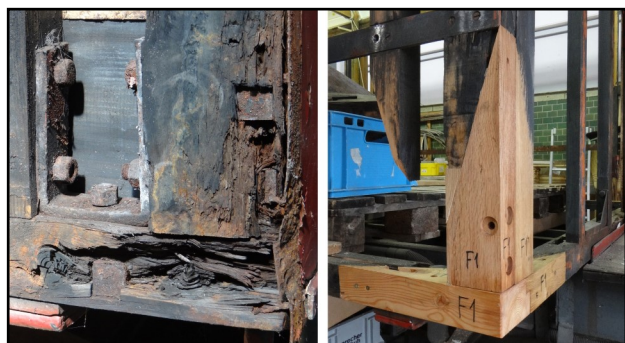
Eine Wagenecke vor und nach der Reparatur

Nach dem Ausbau aller Einbauten, die der Wagen als Hilfswagen hatte, und der Entfernung der Innen- und Aussenwände, des Bodens etc., zeigte das tragende Wagengerippe beachtliche witterungsbedingte Schäden: Alle vier unteren Kastenecken, ein grosser Abschnitt eines Bodenbalkens, die Hälfte einer Dachpfette, Teile der Tor- und Fensterpfosten etc., mussten ersetzt werden. Der Rest wurde gereinigt, alte Schraubenlöcher gefüllt und neu imprägniert. Die ursprüngliche Verwendung als reiner Personenwagen liess sich gut aus der Position der alten Fensteröffnungen erkennen.