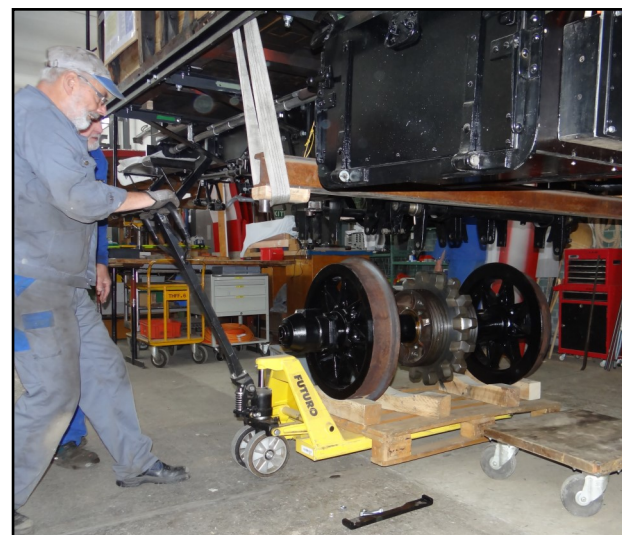
Einachsen der revidierten Radsätze

se-Gäste und bahndienstliche Hilfsmittel für Betrieb und Rettung beinhalten. Der Gepäckraum bietet Platz für einen Rollstuhlpassagier. Später könnte allenfalls eine Stehbar eingerichtet werden.