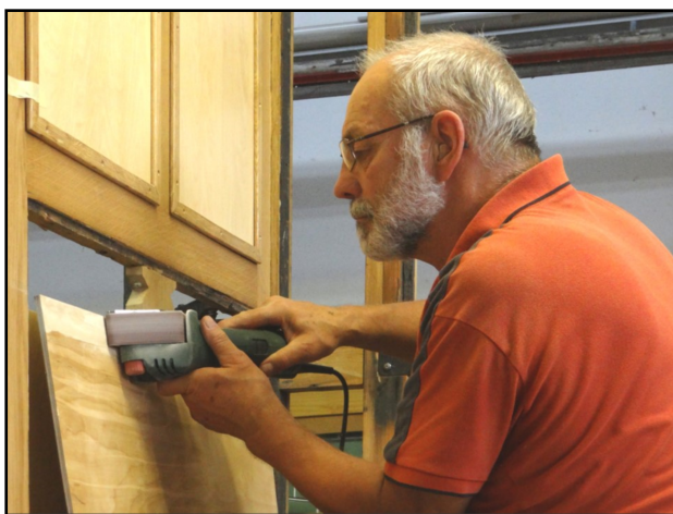
Sorgfältige Einpassung der Wandplatten aus Birkenperrholz

Nun begann die Arbeit an der inneren Verkleidung des Kastengerippes mit Birken-Sperrholzplatten, Sockelbrettern und unzähligen Deckleisten. Im Dachbereich haben wir das sichtbare Täfer repariert und einschliesslich der Dachspanten weiss gestrichen. Die verschlossenen Lüftungsöffnungen wurden wieder aktiviert, aussen mit Lüfterhüten und innen mit Messinglüftern versehen. Das Alublechdach selber wurde abgehoben, eine Unterdachfolie ausgebreitet und wieder montiert. Stets achteten wir auf den Einsatz der bewährten Massnahmen zur Verhinderung von Witterungsschäden wie Fensterfolien, rostfreie Materialien und konsequente Silikonabdichtungen.