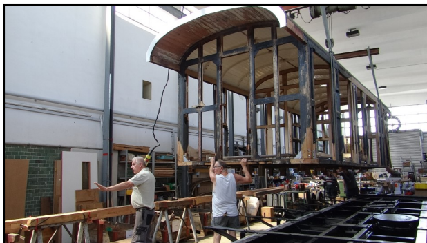
Rücktransport des Wagenkastens auf das revidierte Chassis

Das Chassis wurde danach mit schwarzer Deckfarbe lackiert. Anschliessend bauten wir die in der Zwischenzeit revidierten Teile der Bremsanlage und des Fahrwerks wieder ein. Alle diese Teile waren noch brauchbar und konnten revidiert werden. Das abgenutzte Bremszahnrad wurde durch ein neues ersetzt, wobei beim Tauschvorgang an der Achswelle und einem Radstern Schäden zu Tage traten, so dass auch diese Teile ersetzt werden mussten. Das hölzerne Gerippe des Kastens, an dem in der Zwischenzeit weitergearbeitet worden war, wurde wieder auf das nun revidierte Chassis gestellt und verschraubt.